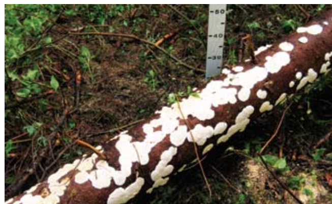
Sakņu piepes auglķermeņi uz izgāztas, mežā atstātas trupējušas egles stumbra

Viss iepriekš minētais precīzi norāda, kādi pasākumi ļautu ierobežot sakņu trupes izplatību: