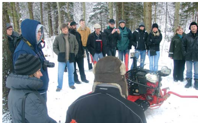
Mežu īpašnieki atzina, ka mazu meža īpašuma apsaimniekošanai piemērotākais ir «Dzelzs zirgs»

Pēc teorētiskās daļas semināra dalībnieki pa likumotajiem ceļiem traucās uz Ērgļiem. Arodvidusskolas ēdnīcā nobaudījuši īsti latviski bagātīgas un garšīgas pusdienas, visi pasākuma interesenti devās uz Ērgļu arodvidusskolas mežu, kur jau dabā iepazīnās ar iepriekš minēto vieglo meža tehniku. Gan «Dzelzs zirga» ar papildaprikojumu, gan kvadracikla ar piekabi demonstrējumi klātesošajos izraisīja nopietnu interesi. Mežu īpašnieki atzina, ka mazu meža īpašuma apsaimniekošanai piemērotākais ir «Dzelzs zirgs», bet racionālāks un daudzveidīgāk pielietojamāks ir kvadracikls ar pareizu papildu aprikojumu. Ikviens pārliecinājās, ka šīs iekārtas ir labs palīgs meža darbos — mazjaudīga un svara ziņā viegla tehnika, kas viegli manevrējama un ar labu caurgājamību, kā arī labi pielietojama malkas, papīrmalkas un sīkbaļķu savākšanai, vējgāžu likvidēšanai, meža stādīšanas darbos un medību saimniecībā.