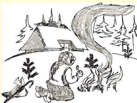
V. Kikuča zīm.

Perioda izsludināšana dara zināmu visiem valsts iedzīvotājiem, ka iestājies meža ugunsnedrošais laikposms, kad jābūt īpaši uzmanīgiem ar uguni mežā un, ka jebkura neuzmanīga rīcība ar uguni var kļūt par cēloni meža ugunsgrēkam un šādai rīcībai sekos arī vainīgā saukšana pie atbildības. Atkarībā no mežam vai īpašumam nodarītā kaitējuma apmēriem var iestāties administratīvā, civiltiesiskā vai pat kriminālatbildība.