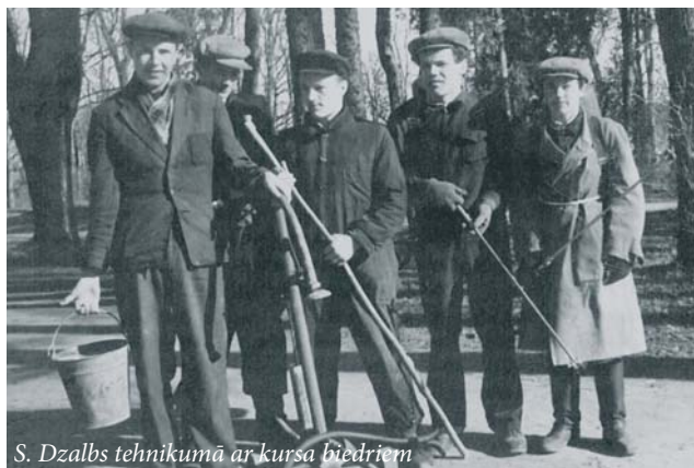
S. Dzalbs tehnikumā ar kursa biedriem