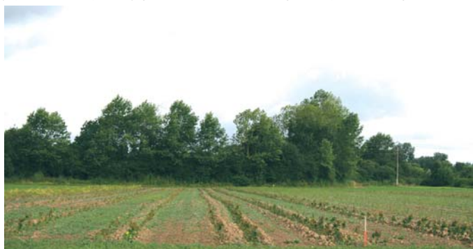
Kooperatīvs Francijā, Šampanjas reģionā, ir ierīkojis eksperimentālos stādījumus dažādiem ātraudzīgajiem enerģētiskajiem kokaugiem, tostarp akācijai.