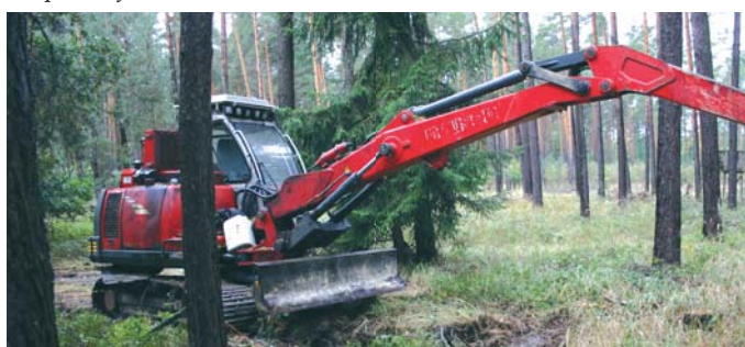
Hārvesters uz miniatūra ekskavatora bāzes - optimāls risinājums krājas kopšanas cirtēs vienā no vācu kooperatīviem.