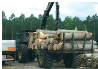
Privātie mežsaimnieki Francijā, līdzīgi kā pie mums, koksnes pievešanai izmantoto atbilstoši pielāgotu lauksaimniecības tehniku.