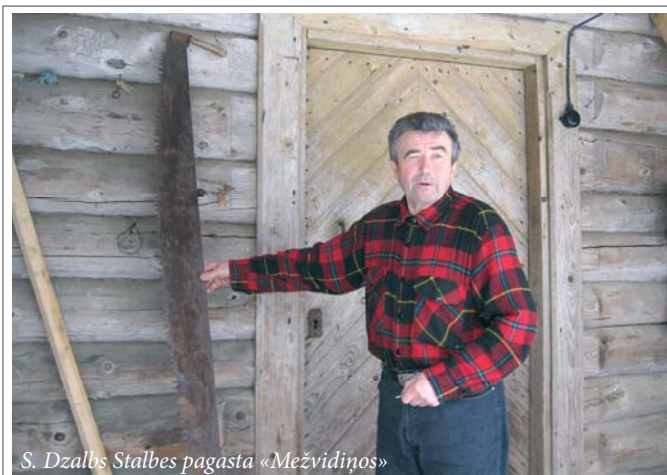
S. Dzalbs Stalbes pagasta «Mežvidiņos»

Sākās diezgan skarbs laiks. Sākumā kopmītnes bija iekārtotas bijušās muižas bēniņos, bet pēc tam pārveidotā zirgu stallī. Aizupes meža tehnikums atradās diezgan nomaļā vietā. Tuvāk dzelzceļa stacija — Tukumā, līdz tai apmēram 40 kilometri. Audzēk-