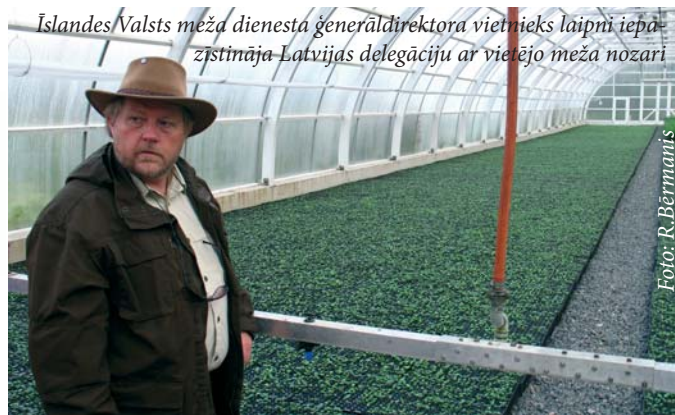
Īslandes Valsts meža dienesta ģenerāldirektora vietnieks laipni iepazīstināja Latvijas delegāciju ar vietējo meža nozari