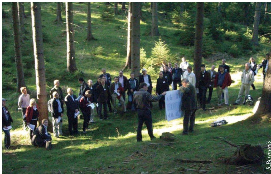
Otrajā konferences dienā prezentācijas tika organizētas lauka apstākļos